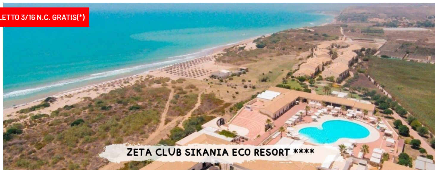
ZETA CLUB SIKANIA ECO RESORT ****

Quote a persona in doppia classic soggiorno 7 notti - trattamento di pensione completa con bevande ai pasti.