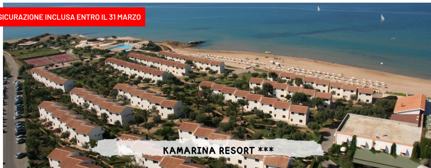
KAMARINA RESORT ***