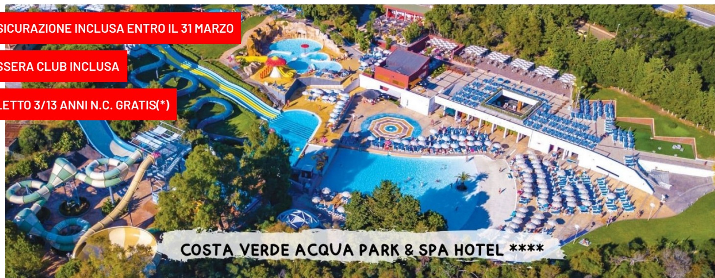
COSTA VERDE ACQUA PARK & SPA HOTEL ****