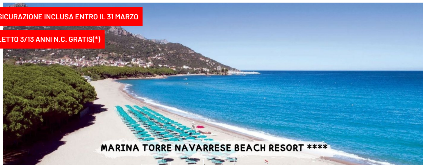
MARINA TORRE NAVARRESE BEACH RESORT ****