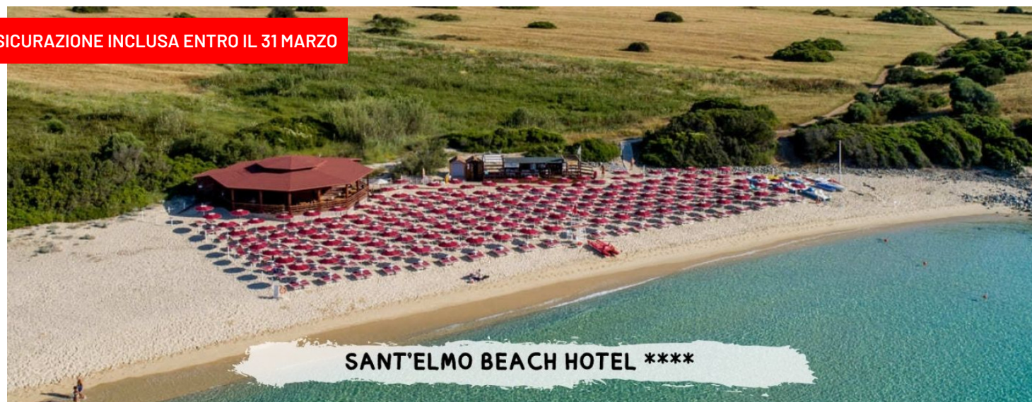
SANT'ELMO BEACH HOTEL ****