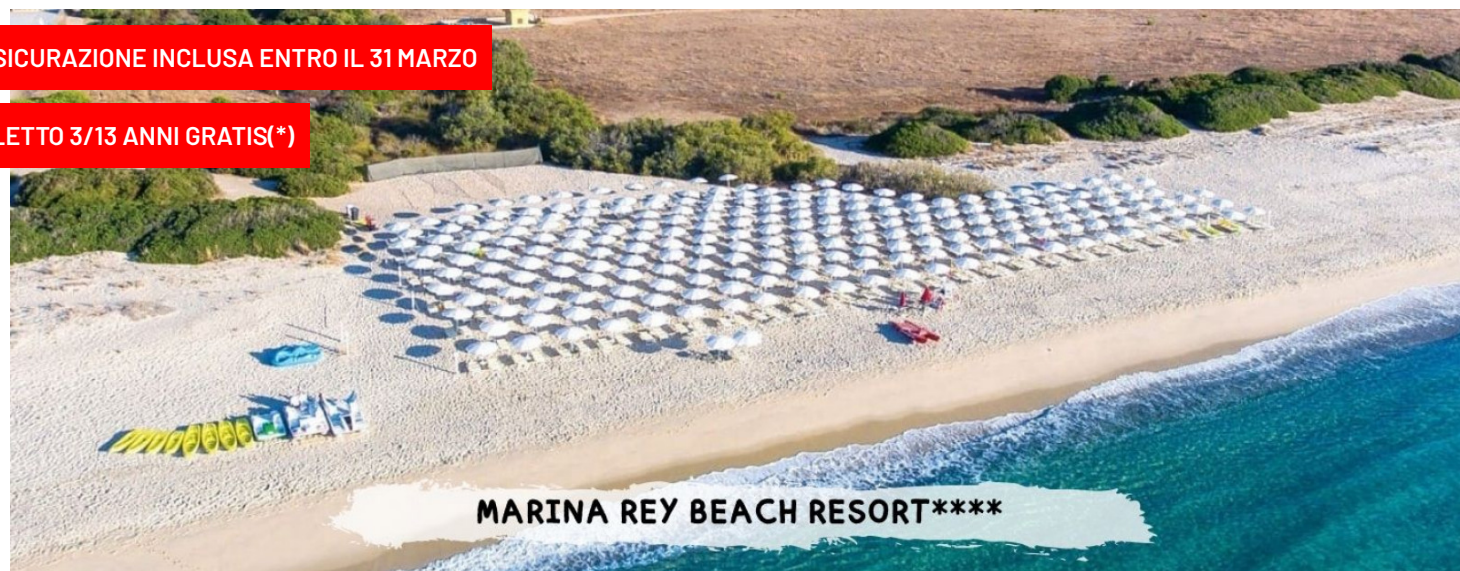
MARINA REY BEACH RESORT****

PER LE TUE SETTIMANE SPECIALI CLICCA QUI