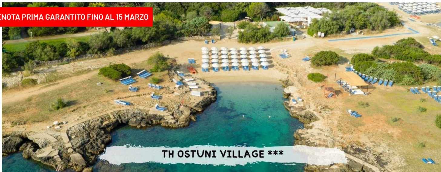
TH OSTUNI VILLAGE ***

PRENOTA PRIMA GARANTITO FINO AL 15 MARZO