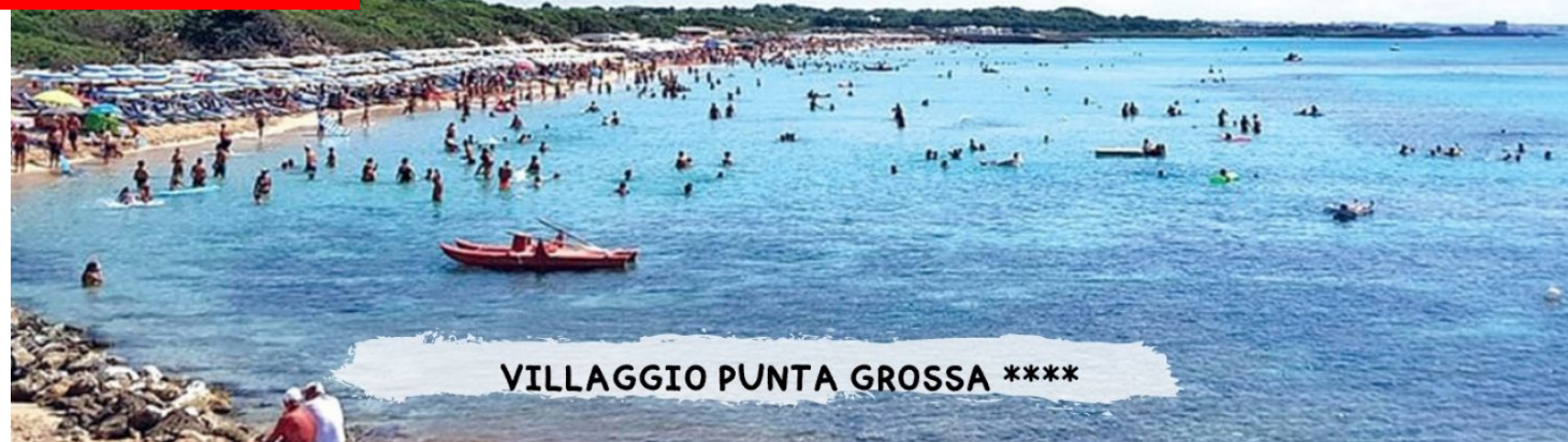
VILLAGGIO PUNTA GROSSA ****