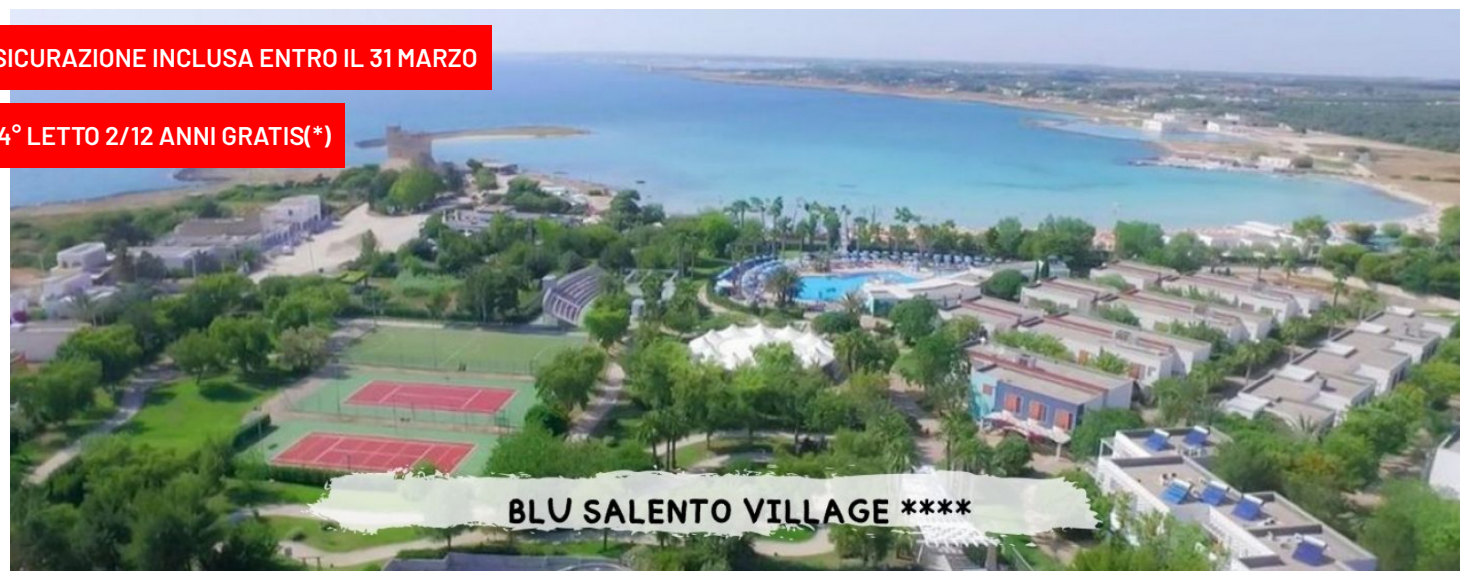
BLU SALENTO VILLAGE ****