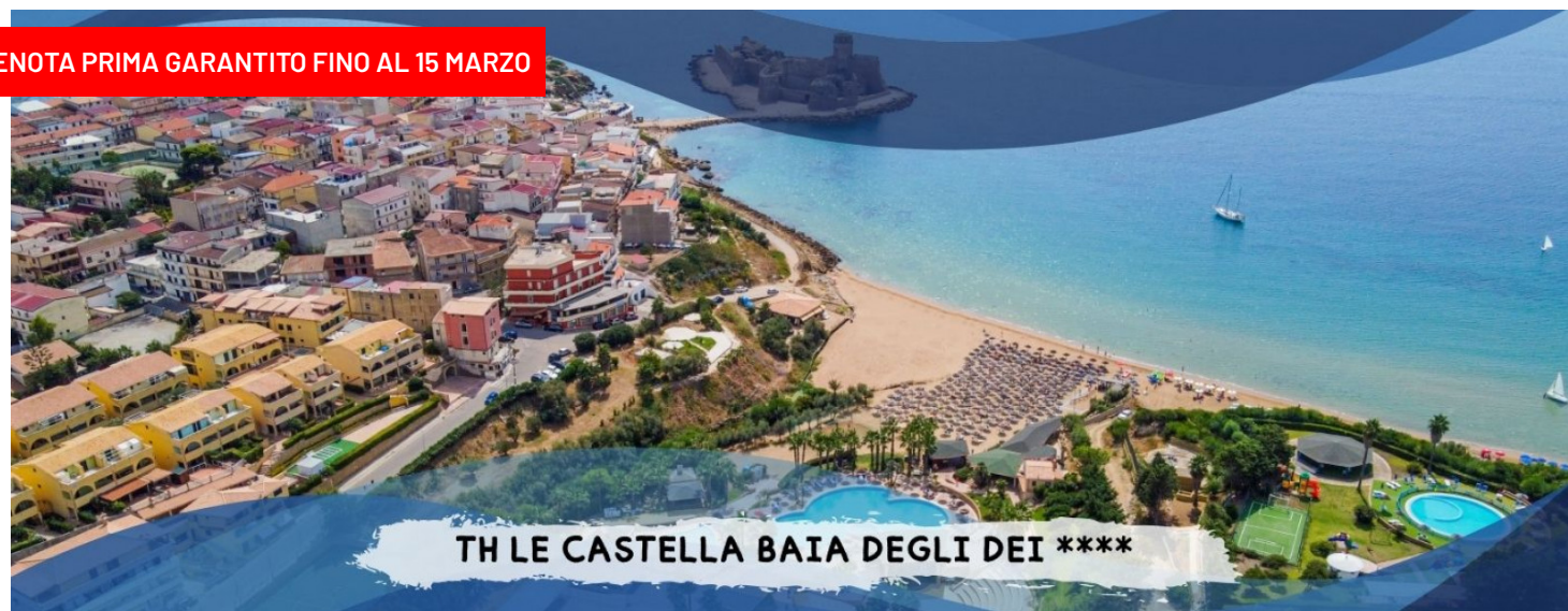
TH LE CASTELLA BAIAGLI DEI *****

PRENOTA PRIMA GARANTITO FINO AL 15 MARZO