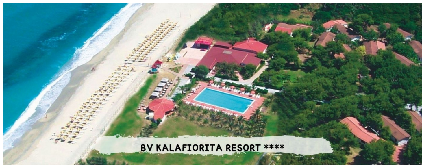
BV KALAFIORITA RESORT ****