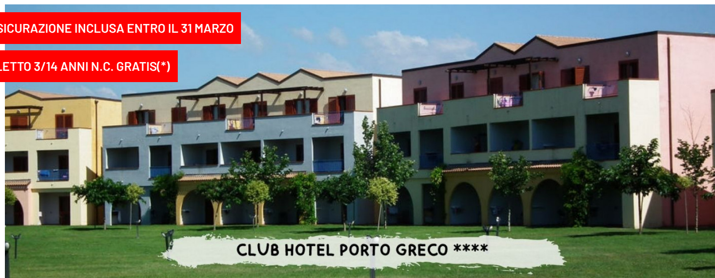
CLUB HOTEL PORTO GRECO ****

quote a persona in pensione completa – bevande incluse in formula "mondotondo club"