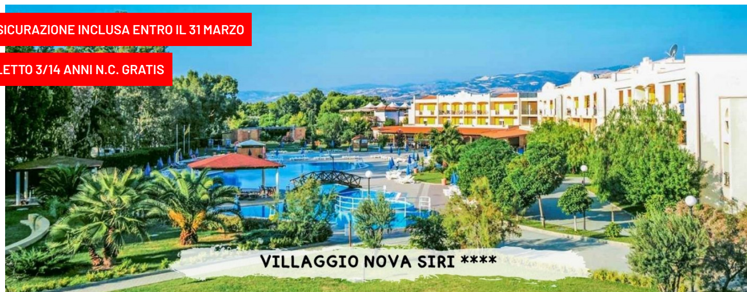
VILLAGGIO NOVA SIRI ****