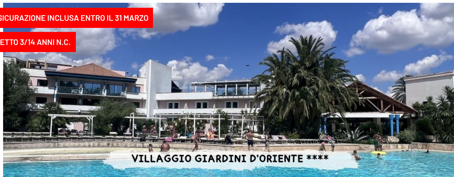
VILLAGGIO GIARDINI D'ORIENTE ****