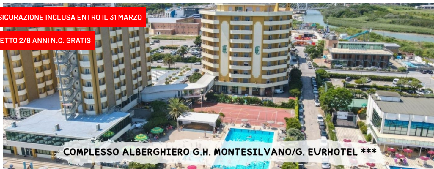
COMPLESSO ALBERGHIERO G.H. MONTESILVANO/G. EURHOTEL ***